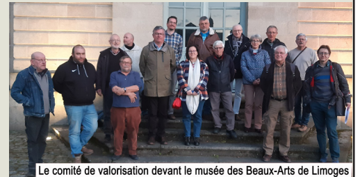
Le comité de valorisation devant le musée des Beaux-Arts de Limoges

Le comité s'est ensuite tenu en présence des membres ou de leurs représentants (professeur Racinet, direction du musée des Beaux-Arts, direction des Archives Départementales, DRAC archéologie, communauté