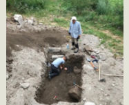
Bâtiment étang des chambres

Comme à son habitude, le Professeur Racinet assurera des