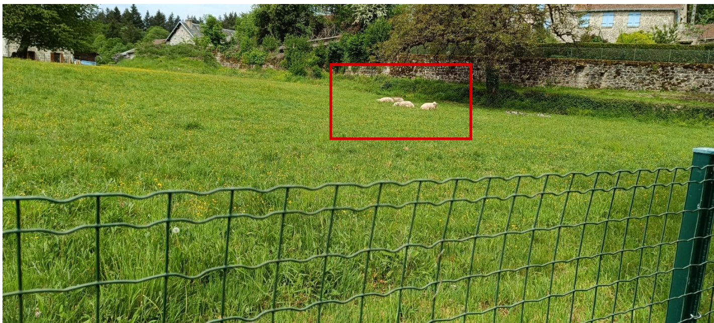
... s'est effectuée sous le regard placide de tondeuses à quatre pattes !