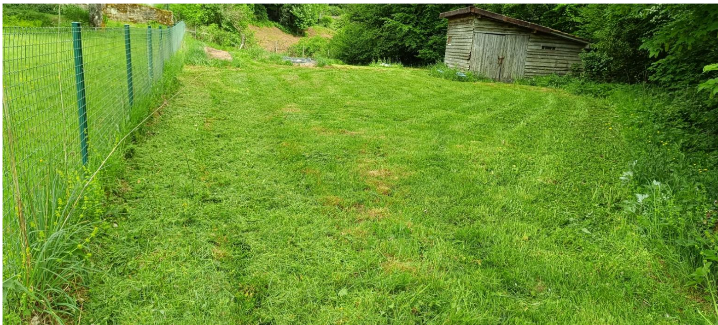
La tonte réalisée par Gérard près de la cabane...