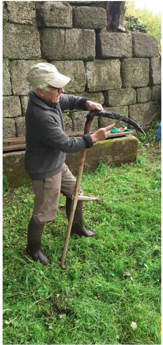
Claude use d'une méthode plus traditionnelle...