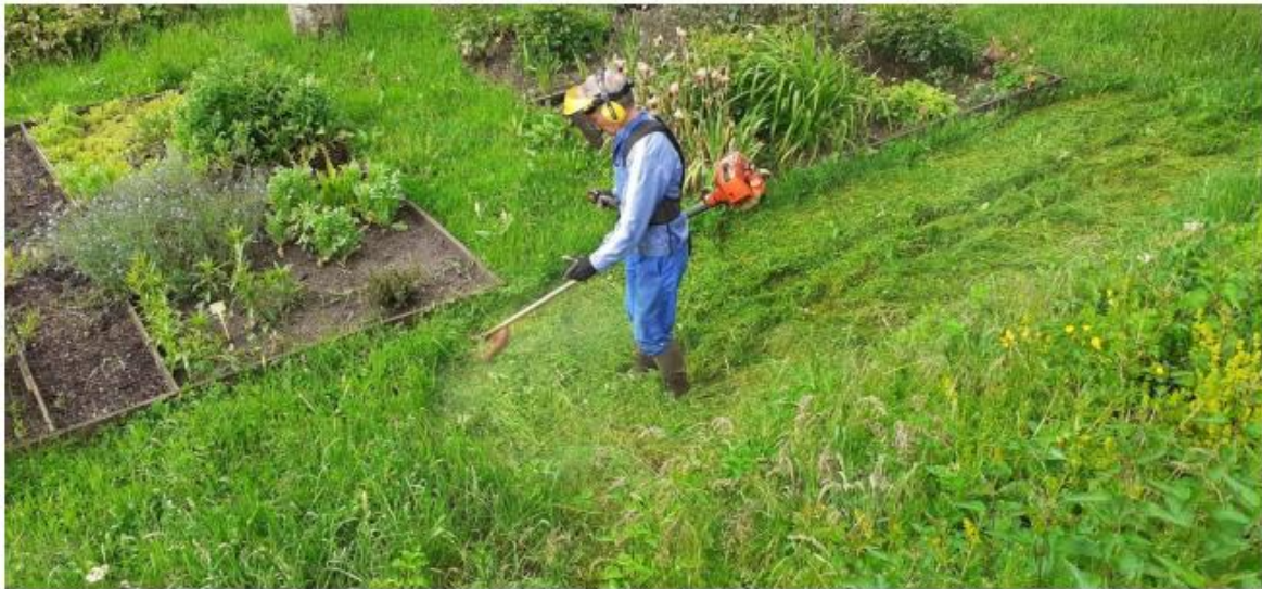
pendant que Gérard effectue le nettoyage des allées du jardin.