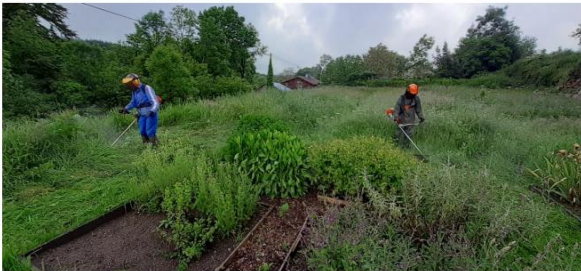
avant la reprise du travail.