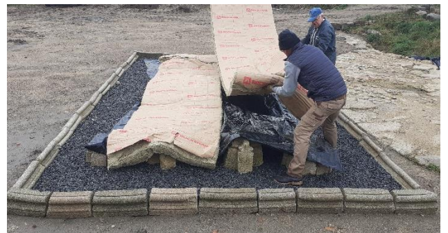
Laine de roche