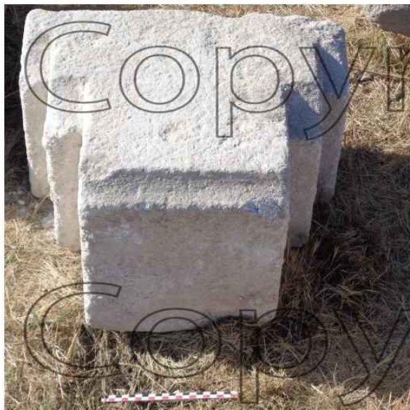
LAP8. Plinthe 361