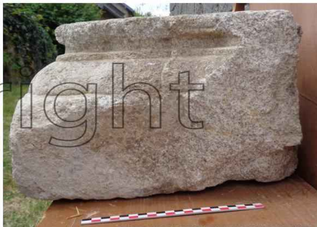
LAP9 et 10. Base 351