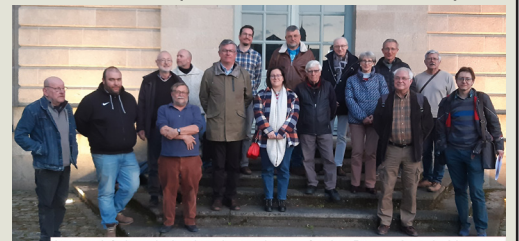
Le comité de valorisation devant le musée des Beaux-Arts de Limoges

Les avancées sur les 4 axes de valorisation ont été présenté en particulier la mise en valeur sécurisée des vestiges remarquables mobiliers et lapidaires dans les salles du musée. Il a été acté qu'en parallèle des copies seraient exposées sur site comme dans des vitrines placées dans la chapelle. Il a été aussi proposé de profiter du 900 ème anniversaire, en 2025, de l'arrivée des frères à Grandmont pour proposer un ensemble d'expositions, de conférences et d'évènements sur le site et au musée des Beaux-Arts. Une équipe de coordination va se mettre en place dès cette année.