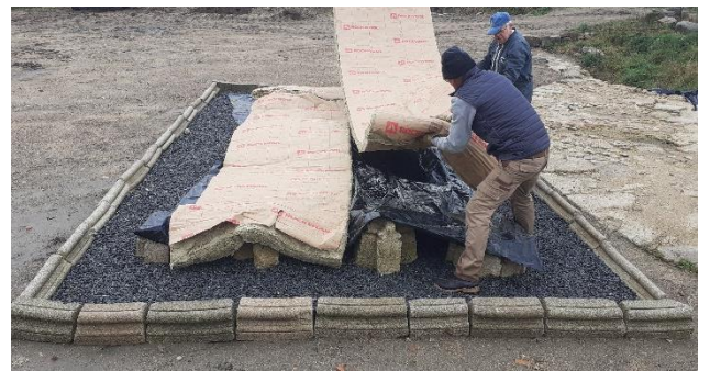
Laine de roche