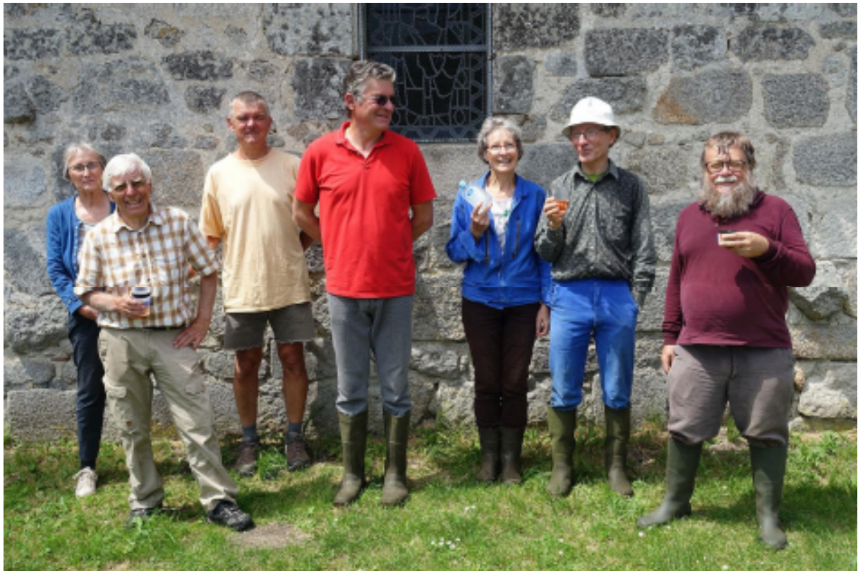
La pause bienvenue de midi.